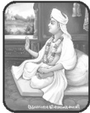
દેહવ્યવસ્થા શ્રીરામાનંદ સ્વામી