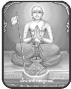
મરિયાદ શ્રી રામાનુજાચાર્ય