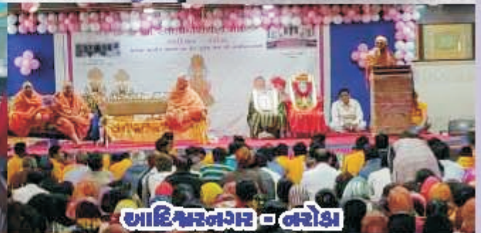
આદિજ્ઞાનનગર - નરોડા