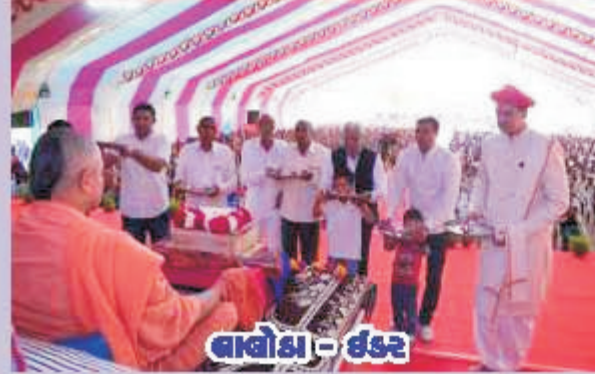
વાલોડા - ઈડર