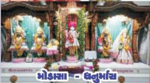
મોહાસા - ઇન્દુભાંચ