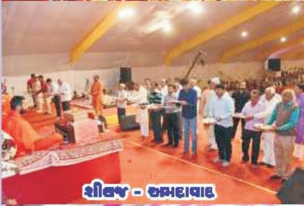
શિવજી - અમદાવાદ