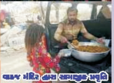
વાજા મંદિર કાચા સમાવૃત્ત પ્રવૃત્તિ