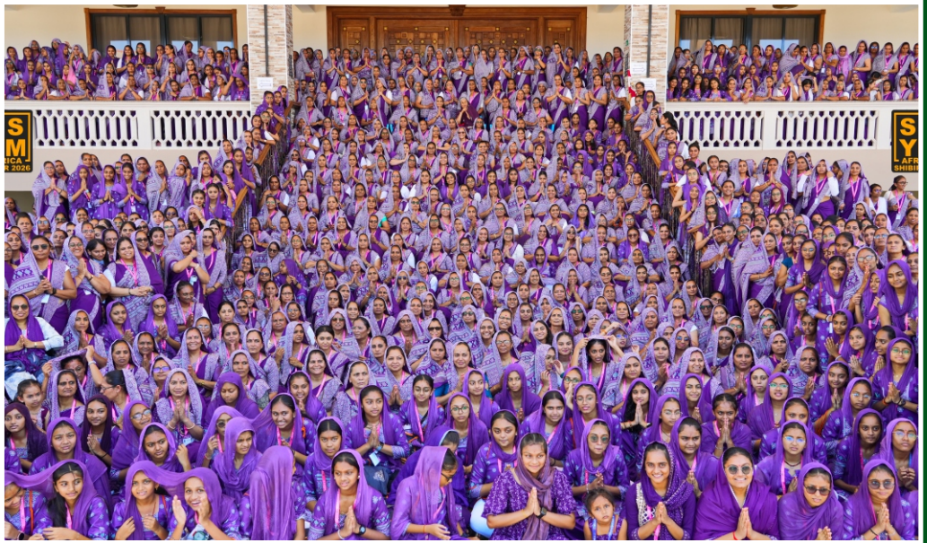
‘ब्रह्मभूत प्रसन्नात्मा’ सत्संग शिबिर (डेव्या-मोम्भासा)